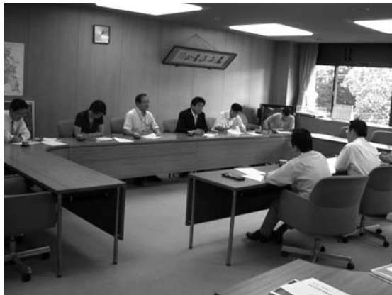
会派から執行部への予算要望風景

9月28日、井崎執行部に対して、会派としての予算要望を提出しました。これは、議会内会派として、次年度、特に施策事業の予算配分を増やして、重点施策として取り組んでいただきたい項目を挙げ、要望するものです。 公園整備をはじめ公共下水道や道路整備、タウンバスの整備等、90項目に渡り要望しました。